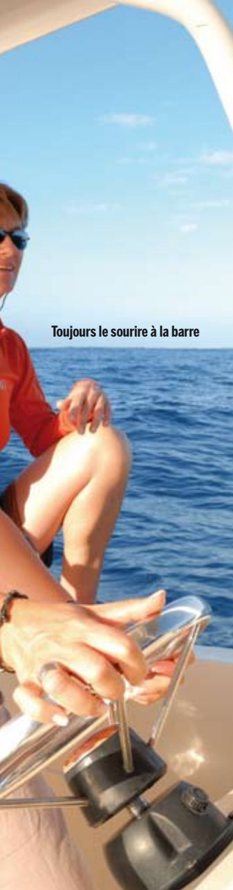
Toujours le sourire à la barre