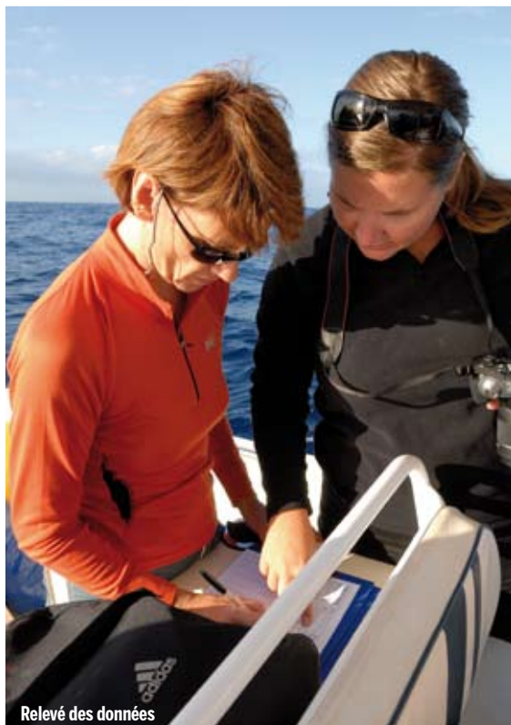
Relevé des données